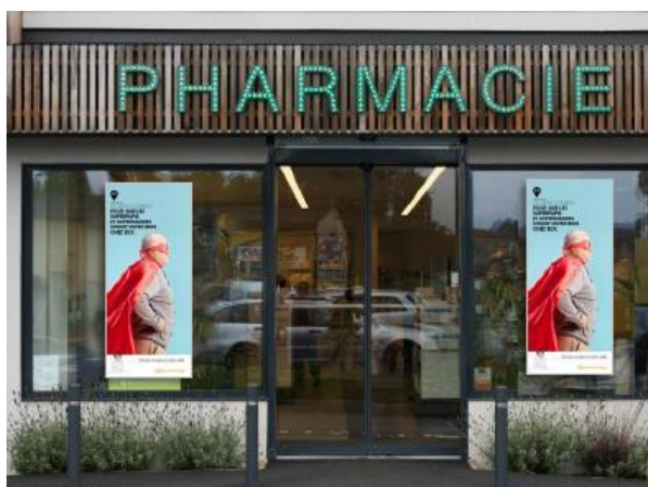
Affiches vitrines visibles depuis l'extérieur de l'officine

Des supports de communication originaux et impactants: