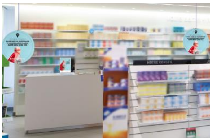
Affichettes de comptoirs et mobiles à suspendre à l'intérieur de la pharmacie.